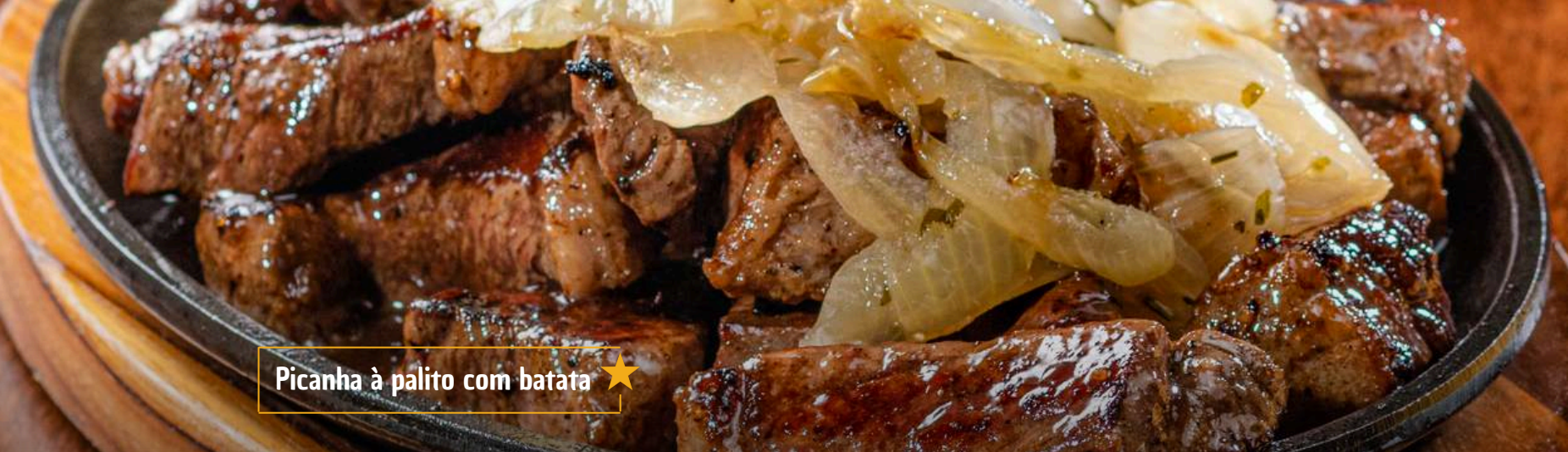
Picanha à palito com batata ★