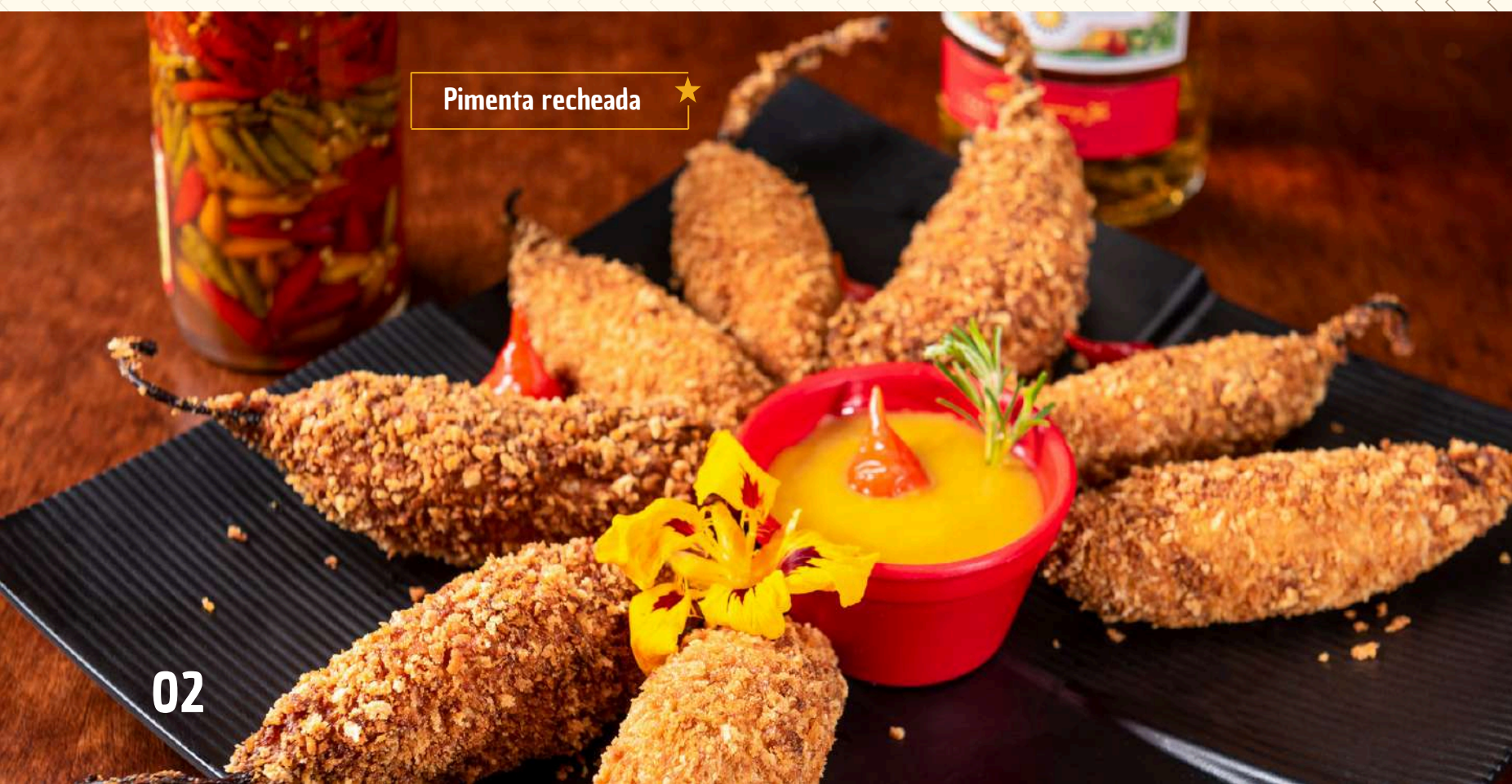
Pimenta recheada ★